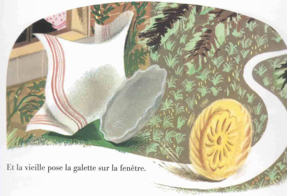
Et la vieille pose la galette sur la fenêtre.

- Elle est trop chaude ! dit le vieux. Il faut la mettre à refroidir ! La vieille pose la galette sur la fenêtre